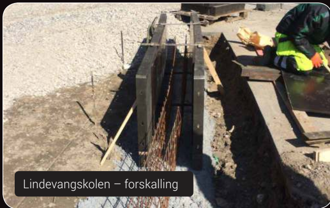
Lindevangskolen – forskalling