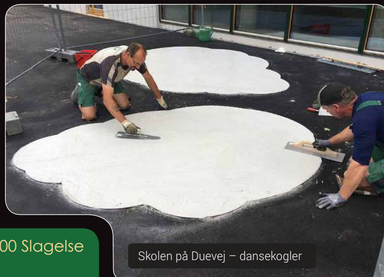
Skolen på Duevej – dansekogler