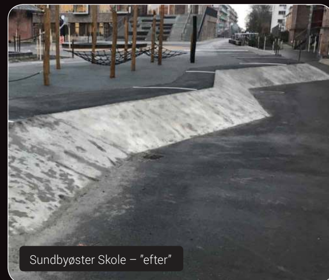
Sundbyøster Skole – "efter"