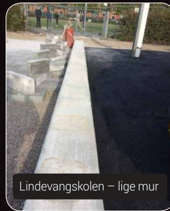
Lindevangskolen – lige mur