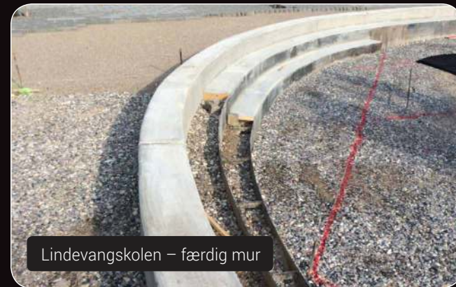
Lindevangskolen – færdig mur