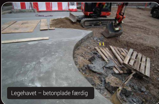
Legehavet – betonplade færdig